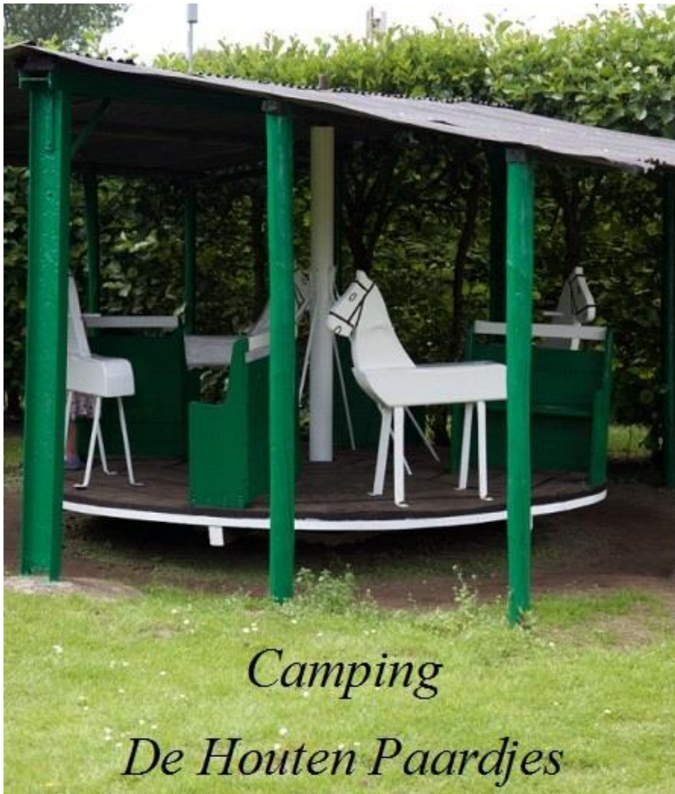
Camping De Houten Paardjes